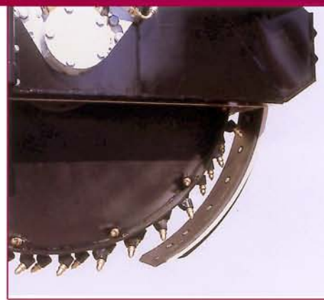
▲ Opcional / Optional Dispositivo vaciado zanja hidráulico Hydraulic trench cleaning device