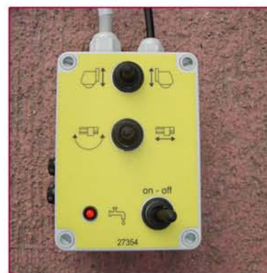
▲ Botonera control de movimientos Switch controls for movements