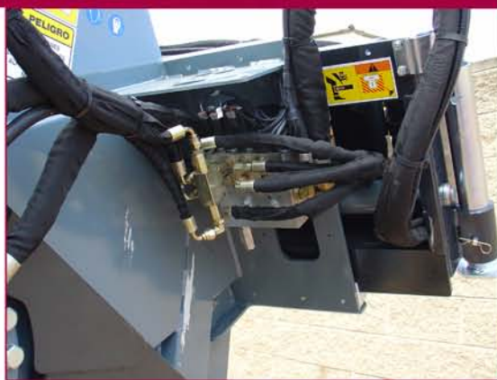
▲ Desplazamiento lateral hidráulico Hydraulic sideshift