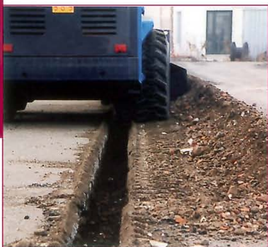
▲ Evacuación material a un lado (opcional) Exit the material to oneside (optional)