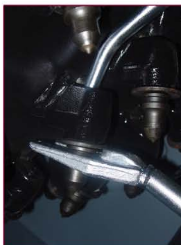
▲ Tambor y llave para extraer las picas Drum and key to takeout the tools