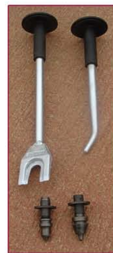
▲ Llaves y Picas Keys and tools