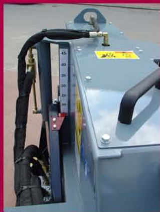
▲ Control de profundidad hidráulico Hydraulic depth control