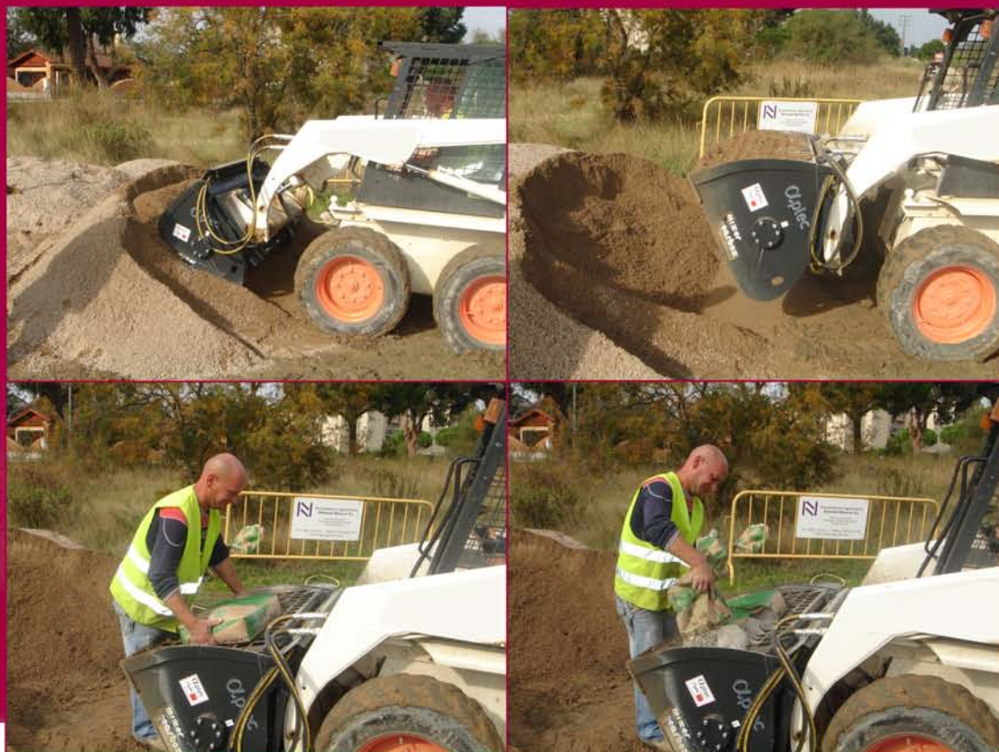
◀ Cargando Loading