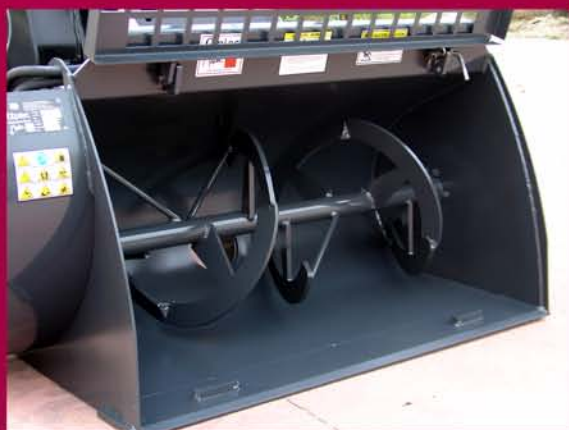
▲ Detalle eje mezclador Mixing axle detail