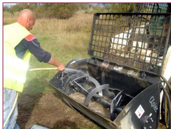
▲ Limpieza tras su utilización Cleaning after been used