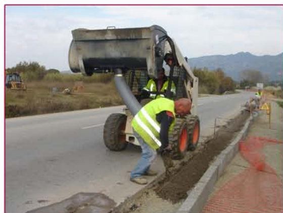
▲ Se descarga con el tubo de vaciado o como cucharón Unloading with discharging tube or as a bucket