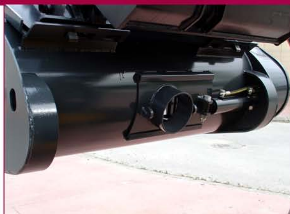
▲ Sistema de vaciado Discharging system