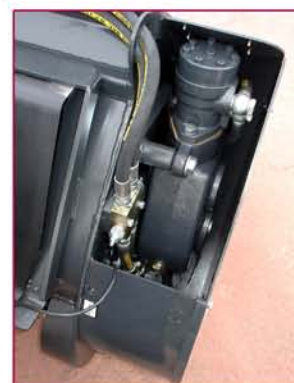
▲ Transmisión por reductor Gearbox system