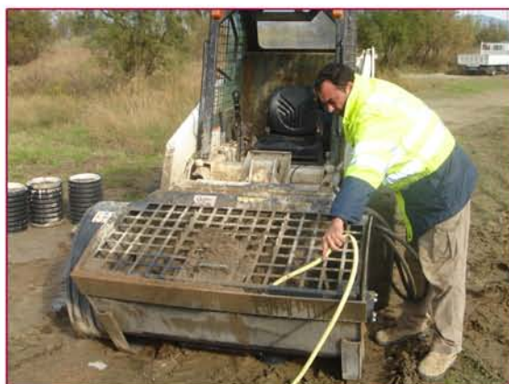
▲ Añadir agua si procede Water adds if it proceeds