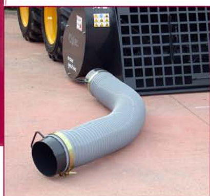
▲ Tubo de vaciado para encofrados Discharging tube