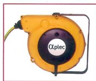
▲ Enrollador eléctrico - opción Electric cable reel - optiono