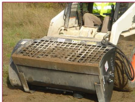
▲ Mezclando Mixing