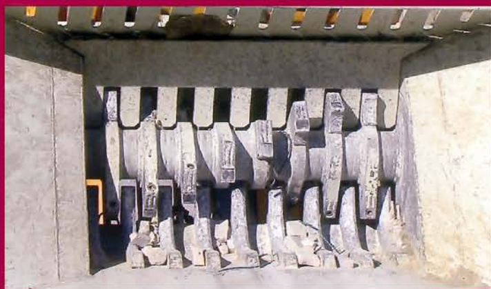
▲ Detalle dientes de corte Detail cutters